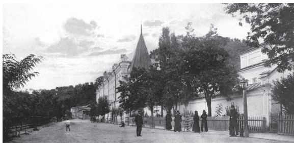
Вид набережной перед гостиницей монастыря.

Но гораздо деятельнее и выгоднее, чем торговля на этом грошовом мужицком базаре, идет коммерция в монастырской