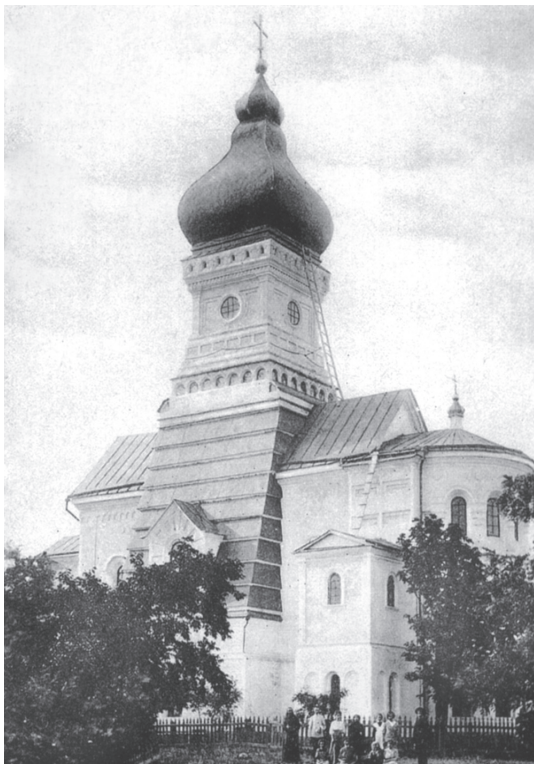
Вид Преображенской церкви на горе Фавор.