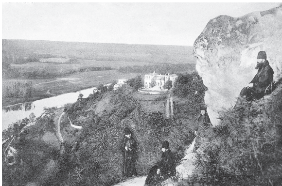
Вид на дом графа Рибопьера.

На вершине горы в сотне сажен от опушки леса, монастырский хутор, где уютится всё экономическое хозяйство монастыря; с четверть версты дальше – монастырское гумно, заставленное скирдами хлеба, стогами сена. Летом на молотьбе работает до 60-ти человек одних монахов, не считая наемных рабочих; монахи воз-