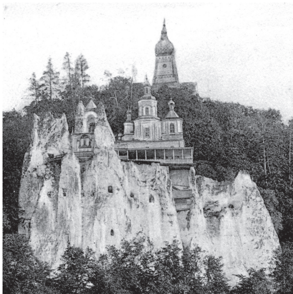
Вид Святогорской скалы и церквей – св. Николая и Преображенской.

стоит, обращенный лицом к монастырю и на всю чудную перспективу красавца Донца, – дворец Потемкиных, перешедший теперь во владение графа Рибопьера.