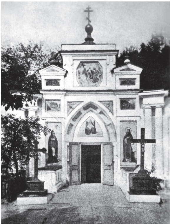
Вход в подземную церковь прп. Антония и Феодосия.