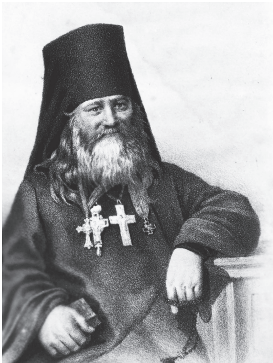
Святогорский архимандрит Арсений, первый по возобновлении обители настоятель с 1844 по 1859 гг.