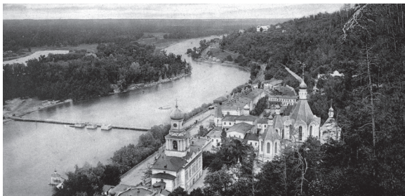
Общий вид Святых Гор от церкви св. Николая, с западной стороны.

Вон белая меловая скала, выпячиваясь, словно башнями своими пятью круглыми выступами, и заострив, словно конические крыши свои меловые верхушки – подня-