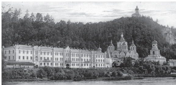
Вид на гостиницу Святогорского монастыря с северной стороны.

Народу в монастырь набралось очень много. Хотя главный приток богомольцев бывает ко дню Успения да к Николину дню, – главным престольным праздникам монастыря, но послезавтра Покров, – тоже один из многочисленных храмовых дней этой богатой храмами лавры, – по этому