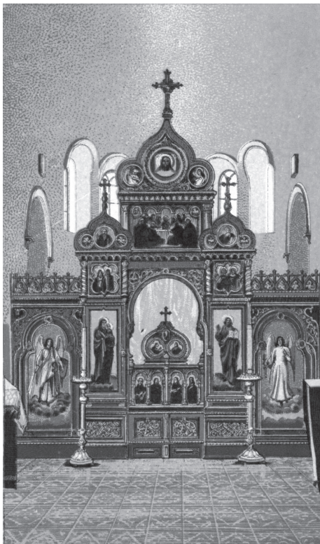
Вид Иконостаса Преображенской церкви.