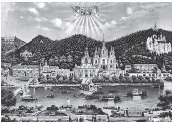
Вид Святогорского Успенского монастыря в нач. XX в.

Обитель эта играла в истории степной Руси почти ту же роль, какую Сергиево-Троицкая Лавра или Соловецкий монастырь играли в истории Северной Руси.