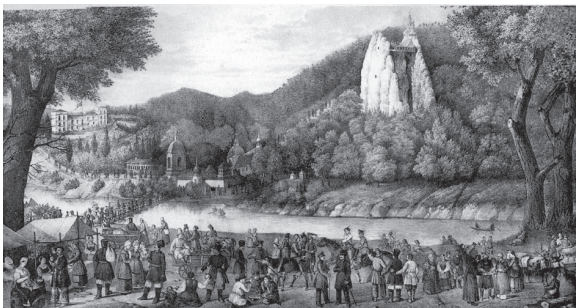
Вид святогорского монастыря в дни возобновления в 1844 г.

Таково было в течение многих веков русской истории великое государственное значение Святогорского монастыря. Его горные твердыни, защищенные с одной стороны пучинами реки, с другой стороны глухими лесами, были своего рода конечным острием того железного клинка, который вбит был русскою государственною силою в глубину степей, под самое сердце Крымского ханства, целою цепью укрепленных городков, острожков, валов