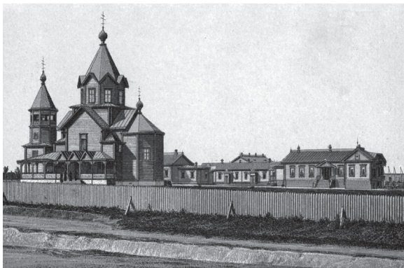
Вид Спасова скита Святогорского монастыря на месте крушения царского поезда.

ми вроде ложек, ножей, деревянных блюд и т.п. Разговорились с одним из монахов-приказчиков и узнали не без удивления, что нередко в один день лавка выручает до 500 рублей.