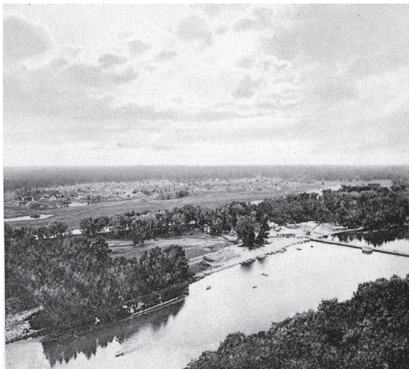
Вид на с. Банное.

панские уголья кругом! Теленок сунется, жеребенок, курица, – сейчас штраф, потрава... Хворостинку в лесу выломлешь, сейчас протокол, в суд... Так разве это житье? Ведь у нас в Банном и Татьянине всей земли по одной десятине на душу, – вот