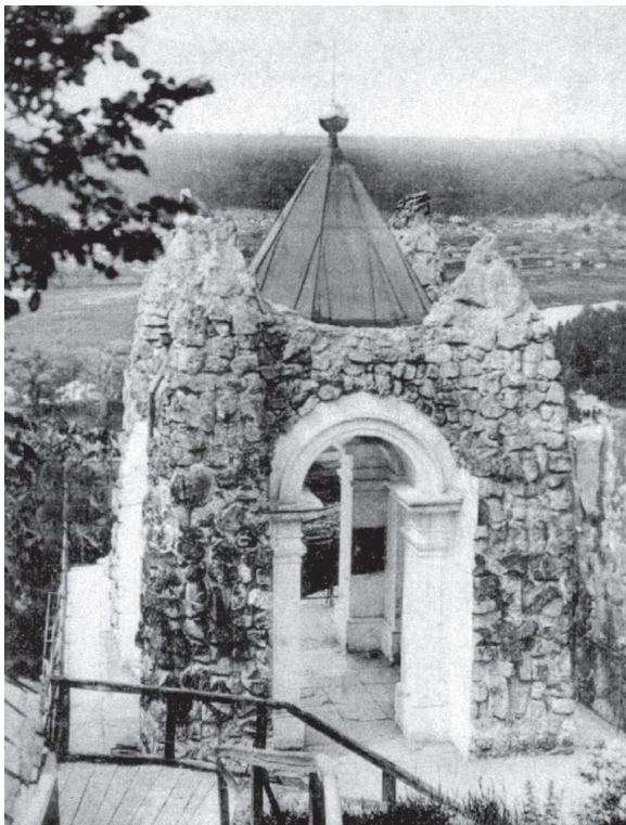
Вид на Андреевскую часовую на меловой скале.