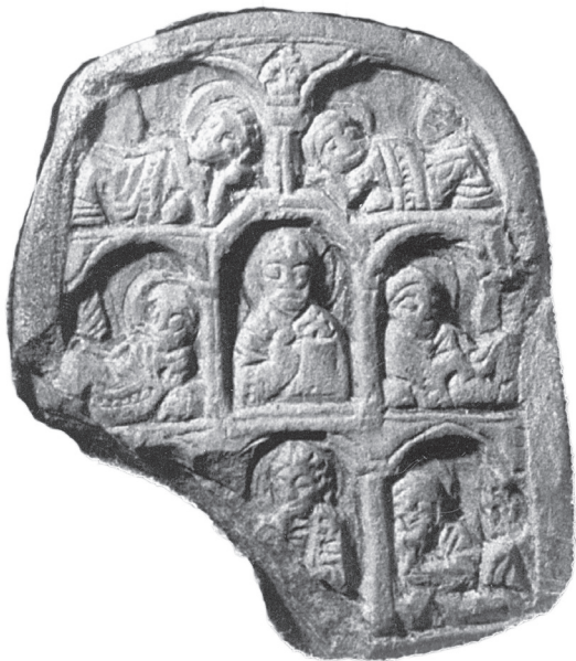
Икона св. Николай и семь отроков Эфесских. Камень. Резьба. XIV в. Исторический музей Святогорского историко-архитектурного заповедника.