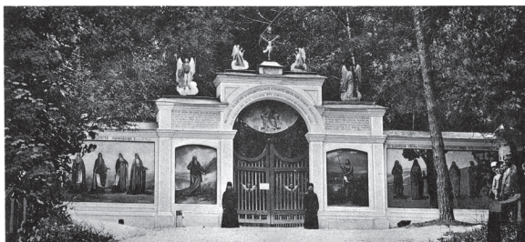
Вид на св. врата Святогорского скита.

Одни записываются на вечное поминовение, другие на определенный срок, на год, на полгода, на несколько месяцев, на несколько дней. Все зависит от размера