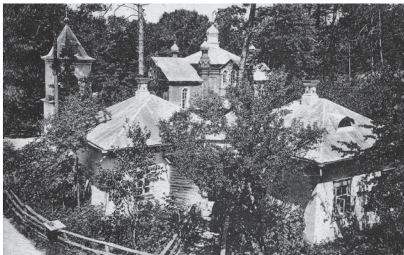
Внутренний вид Святогорского скита.