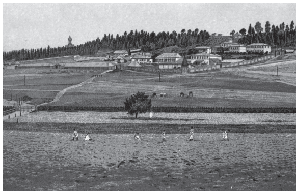
Вид на больничный хутор с церковью во имя Ахтырской иконы Божьей Матери.

– Нет, у нас какие же древности... У нас, слава Богу, все заново теперь отстроено,