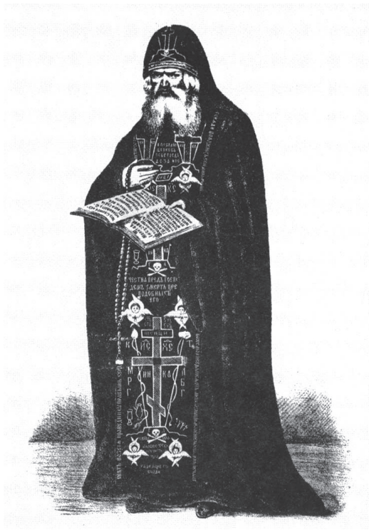
Прижизненный портрет Иоанна Затворника. С литографии XIX века.