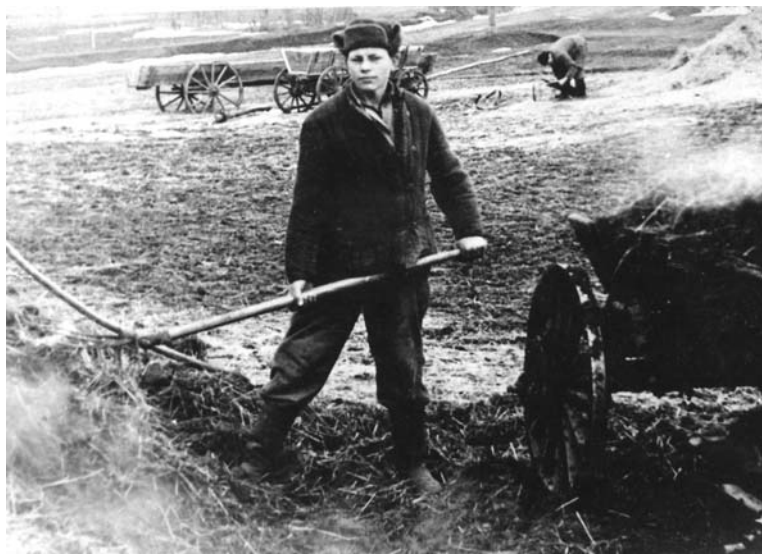
Приходилось возить силос и фураж, работать на всяких работах в колхозе, хотя уже была специальность — каменщик-печник. Село Клиновое. 1957—1958 гг.

Но мы знали, что призывали, служить в армию в возрасте от девятнадцати лет, а зачем сейчас, мы не знали. Однако потом выяснилось — для предподготовки и сдачи «Норм на значок ГТО» (Готов к труду и обороне СССР), а также медицинского