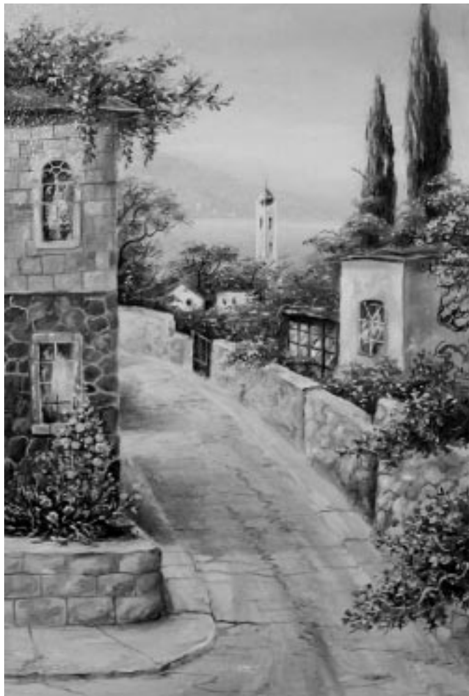
Улочка В Ялте