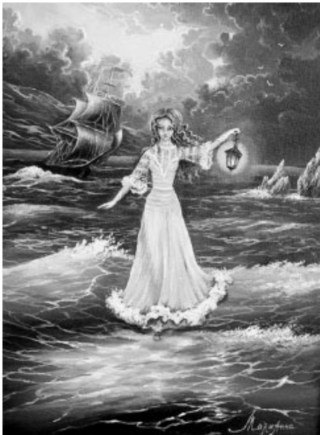
Бежущая по Волнам